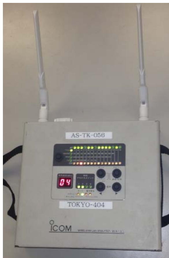
図 1. 無線 LAN アナライザ

無線 LAN アクセスポイントの発する電波（ビーコン）がどこまで届くのかを測るサイトサーベイが一般的である。無線 LAN アナライザを用い、あらかじめ規定したしきい値を下限として、使用エリアをくまなく測定する。